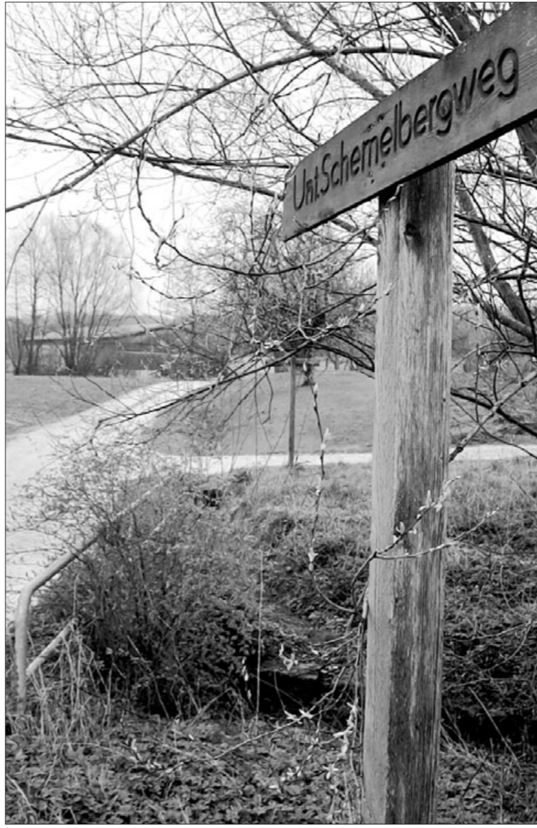
Noch unberührte Natur: Blick auf das Gelände für den geplanten Netto-Einkaufsmarkt in Eschenbach.

Knapp 800 Quadratmeter groß soll die Verkaufsfläche des Marktes werden. Geplant ist auch die Erstellung von 86 Stellplätzen am Markt, wie ein Mitarbeiter der Firma in der Gemeinderatssitzung erläuterte. Große Chance besteht für die Verwirklichung einer Solaranlage, wie